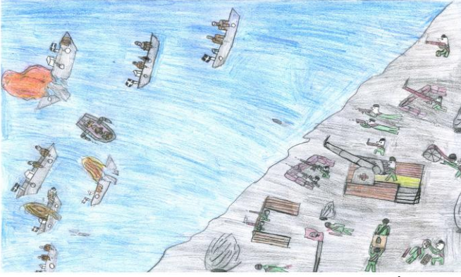
Sinan AYDIN 4/A