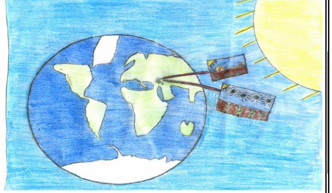
Sinan AYDIN 4/A