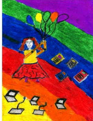
Ersin YILDIZ 4/B