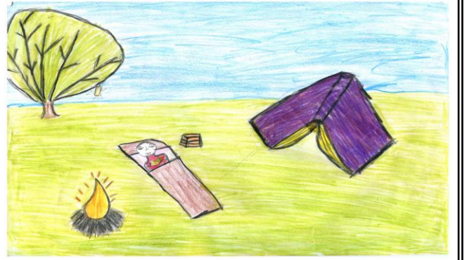
Şilan BİNGÖL 4/A