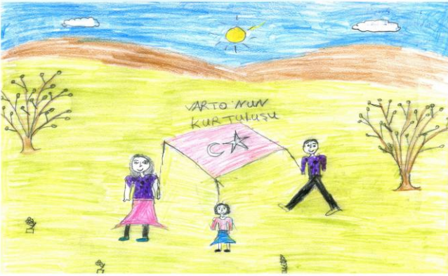
Şilan BİNGÖL 4/A