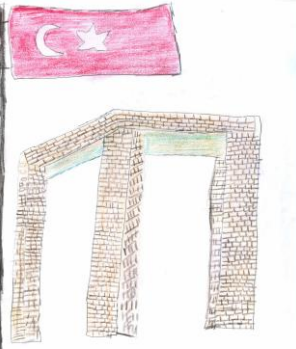
Cem Arda GÜNEŞER 3/A