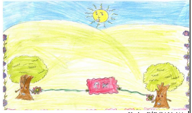
Kader BİRCAN 4/A